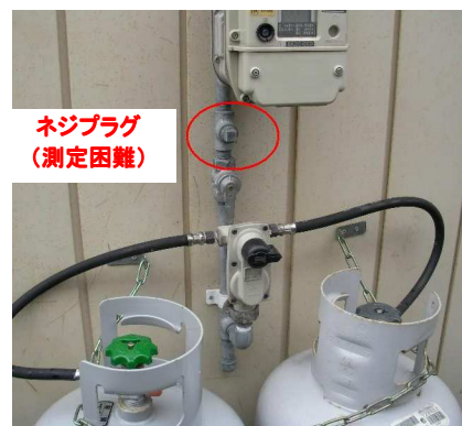
1-1 3)、1-2 2) 調整器出口圧の測定場所（例） （測定が困難な場合は、燃焼器入口圧力を測定する）