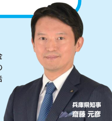
兵庫県知事 齋藤 元彦

兵庫県では6月補正予算を活用し、LPガスを利用されている方々を対象とした料金軽減対策を実施してきましたが、エネルギー価格高騰の長期化を踏まえ、このたびの12月補正予算のもとでも、あらためて対策を講じることとしました。これからも県民生活の安定化に全力を尽くし、誰もが安心して暮らせる兵庫をつくってまいります。