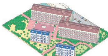
コミュニティーガス団地のお客様