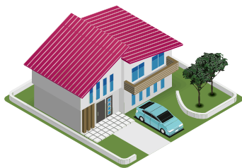
●個別供給のお客様

※一般消費者等とは、液化石油ガスの保安の確保及び取引の適正化に関する法律（昭和42年法律第149号）第2条第2項に規定する一般消費者等をいいます（契約者が公共機関の場合は対象外です）。