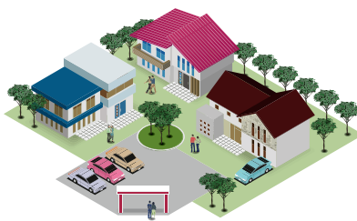
●集団供給のお客様