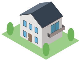
一般家庭のお客様

※工場など生産現場での高圧ガス保安法上の消費者、国及び地方公共団体は対象外となります。 ※大口(1月当たり50㎡以上)契約は対象外となります。