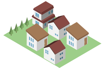
集合供給のお客様