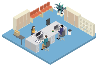
企業(事務部門)のお客様